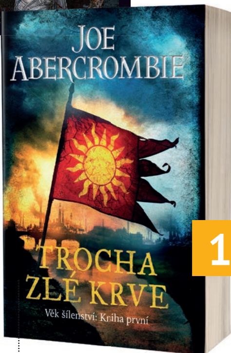
TROCHA ZLÉ KRVE Joe Abercrombie

Do světa trilogie První zákon přišla průmyslová revoluce. To znamená, že mocní mají zase o trochu víc způsobů, jak vyj...t s chudáky, staré pořádky se hrouť v krvi a skřípotu zubů a staří kretění vrčí na mladé kretény. Prostě cynická jízda, u které se budete navěnek smát a v srdci plakat. Inu, Joe je pán.