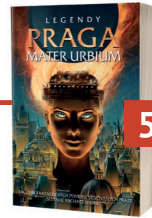
PRAGA MATER URBIUM Michael Bronec (ed.)

Malá oddechovka, kterou si autorka stříhla v mezeře mezi dvěma díly Kostičasu , je poctivá osmisetstránková bichlička plná draků, sympatických postav, překvapivě drsných zvratů a vůbec kniha, která nám před létem vrátila víru, že svět (aspoň ve fantasy) bude zase v pořádku.