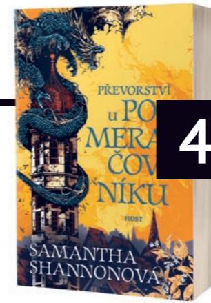
PŘEVORSTVÍ U POMERANČOVNÍKU Samantha Shannonová

Výborné zakončení asi nejvýraznější a z hlediska cen nejspěšnější fantasy trilogie uplynulého desetiletí. Jemisinová má skvělý příběh, neotřelý styl, fascinující svět a naprosto lidské postavy, které čelí konci světa, jaký jste ještě nezažili, a především samy sobě a svým předsudkům.