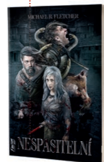
10 NESPASITELNÍ Michael R. Fletcher

Temná, temná fantasy ze světa, kde víra formuje realitu. A když jste dost velký parchant a dokážete manipulovat s dostatkem lidí, jste tu za větší bohy než bohové samotní. Plus partička drsných, odporných a zavrženíhodných válečníků i obsese používáním německých terminů, které dokazují, že právě Němci měli sepsat Necronomicon , ne Arabové... Parádní věc.