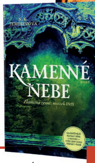
KAMENNÉ NEBE N. K. Jemisinová

Dovolujeme si prorokovat, že na tuhle knihu se jednou bude vzpomínat jako na Vládce strachu instagramové generace. Bravurně napsaná, do posledního slovíčka promyšlená kniha o nechutném stalkingu, převzetí odpovědnosti, obsesi kachnami a tak trochu o obyčejných lidech s neobyčejnými schopnostmi.