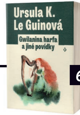
GWILLANINA HARFA A JINÉ POVÍDKY Ursula K. Le Guinová