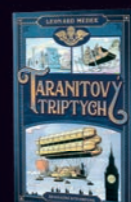
TARANITOVÝ TRIPTYCH Leonard Medek

Poutavý exkurz do časů, kdy muži byli gentlemani, ženy dámami a svět plný tajemství i neskutečných dobrodružství na těch nejzvláštějších místech. Obzvláště pokud jste sloužili v tajné službě a v rámci plnění mise nasazovali život za záchranu světa nebo třeba ženy v nesnázi.