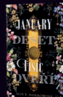
JANUARY A DESET TISÍC DVEŘÍ Alix E. Harrowová

Vloni byly žně snově podivných, atmosférických knížek, které při čtení chutnají na jazyku, vidíte před očima a naplní vám uši svou hudbou. Noční cirkus, Bezhvězdné moře i January mě oslovily všechny, January nejvíc knihomolskou duší, dobovým zasazením a jinými světy.