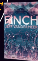
FINCH Jeff VanderMeer